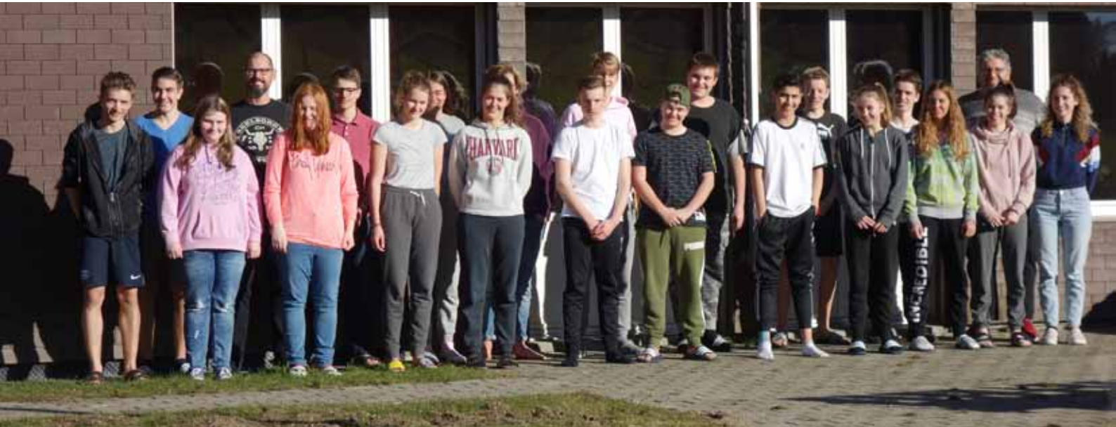
Bildlegende siehe Seite 2